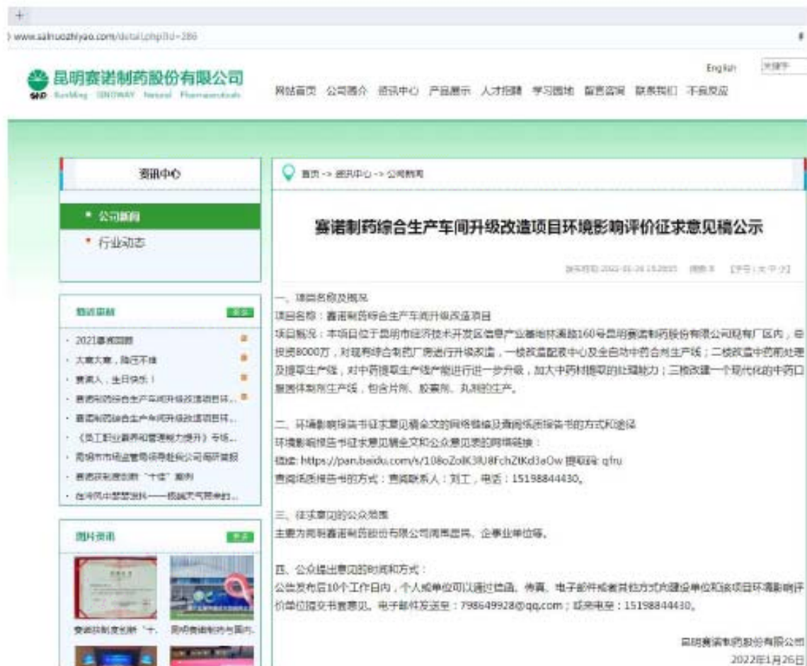
图 3-1 征求意见稿公示——网站公示截图